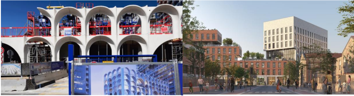
La Porte Bleue - Marseille