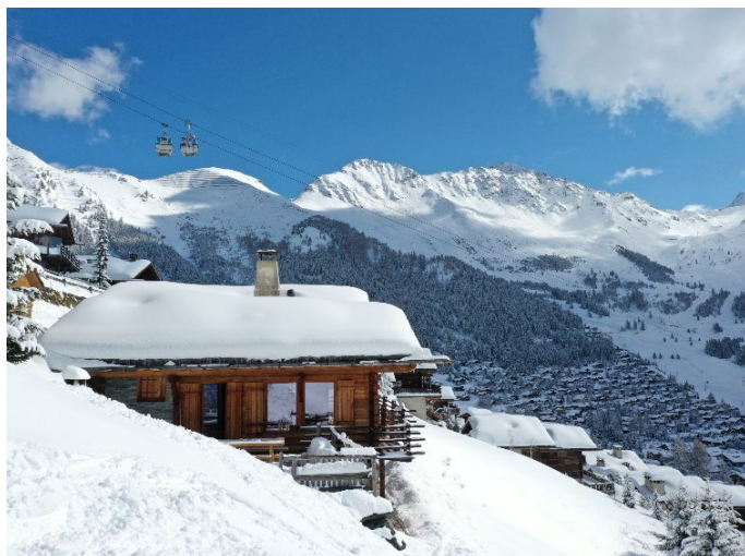
Bien vendu à Verbier – 18,8 M€

Verbier offre le plus grand domaine skiable de Suisse (Verbier 4 Vallées et ses 400 kilomètres de pistes) et une situation idéale sur un plateau ensoleillé. Elle accueille chaque été Le Verbier Festival, un évènement international de musique classique.