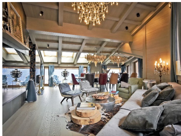
Bien vendu à Courchevel – 26,1 M€

Souvent classée parmi les plus belles stations de ski au monde, Courchevel bénéficie aussi d'une concentration unique d'hôtels cinq étoiles, de palaces et de restaurants étoilés. Son étagement sur plusieurs villages (Le Praz, Courchevel 1550, Courchevel Village, Morion et Courchevel 1850) lui permet de proposer une offre immobilière diversifiée, mais toujours respectueuse de l'architecture locale. La clientèle, majoritairement française, anglaise et belge (on note toutefois l'émergence d'acheteurs turcs en 2023), apprécie la qualité du domaine skiable des 3 Vallées, le plus grand du monde, et ses 600 kilomètres de pistes reliées skis aux pieds. Les chalets de prestige, les grands appartements avec au moins 3 chambres, une vue et, si possible, un accès « skis au pied » sont très prisés.